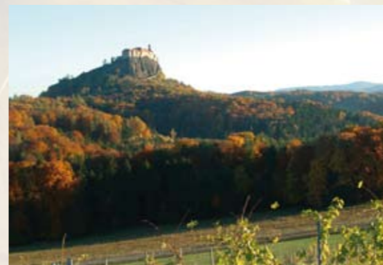
Weithin sichtbar thront die Riegersburg auf einem vulkanischen Felsen.